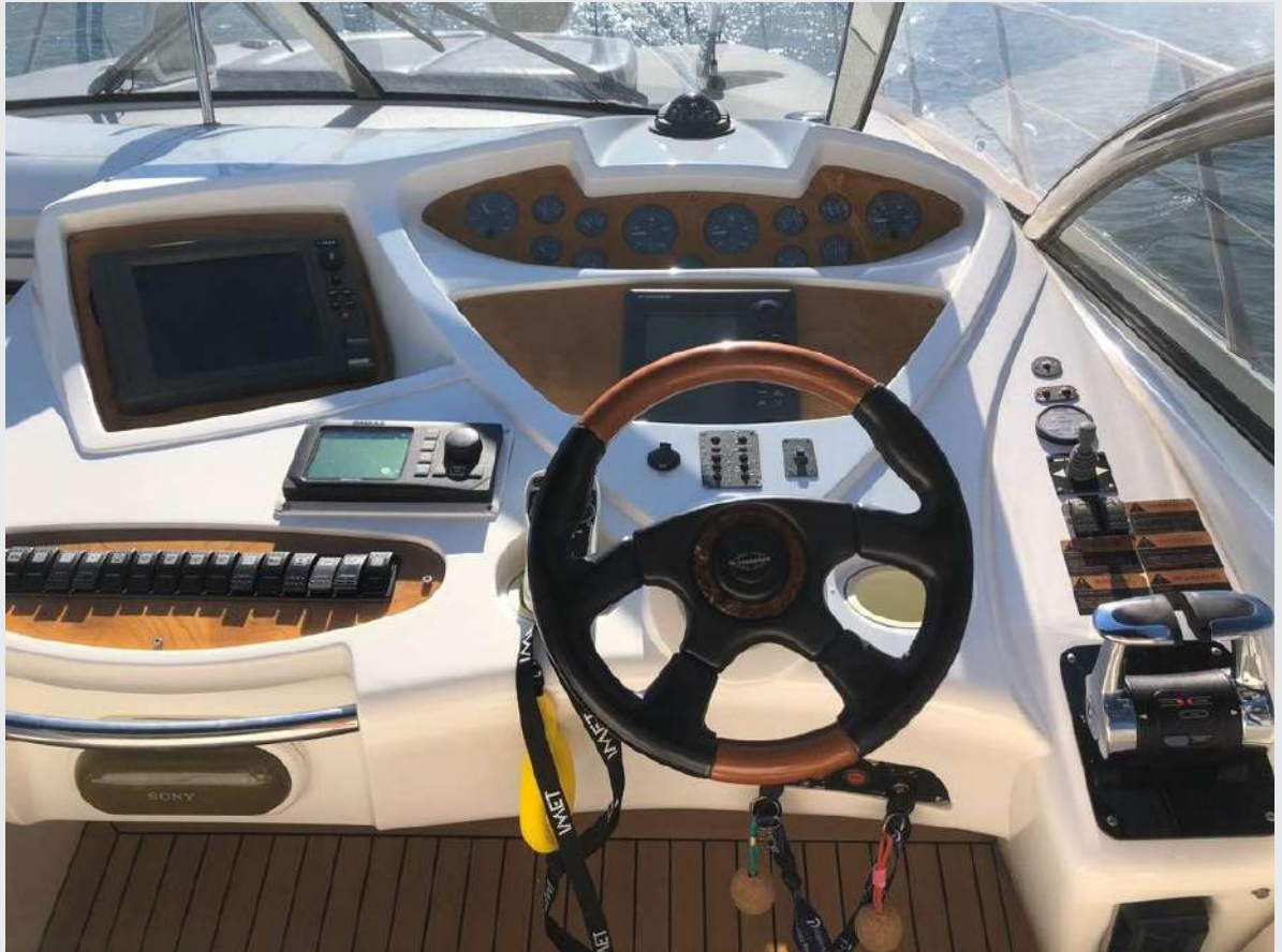
SUNSEEKER 56 PREDATOR