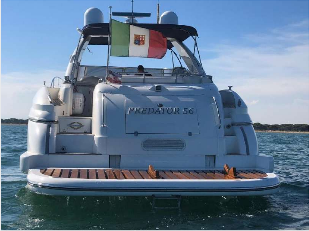
SUNSEEKER 56 PREDATOR