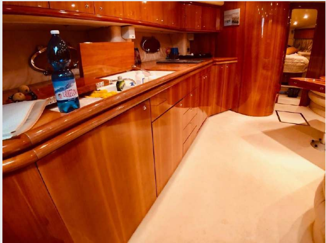
SUNSEEKER 56 PREDATOR