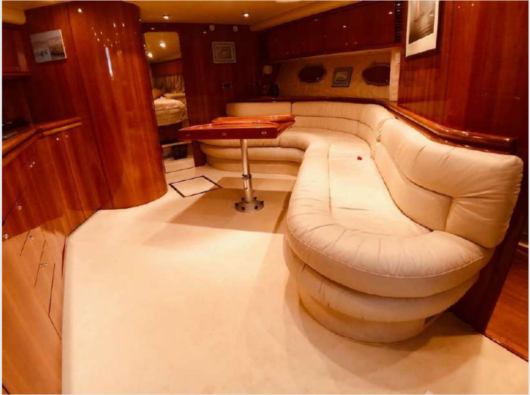
SUNSEEKER 56 PREDATOR