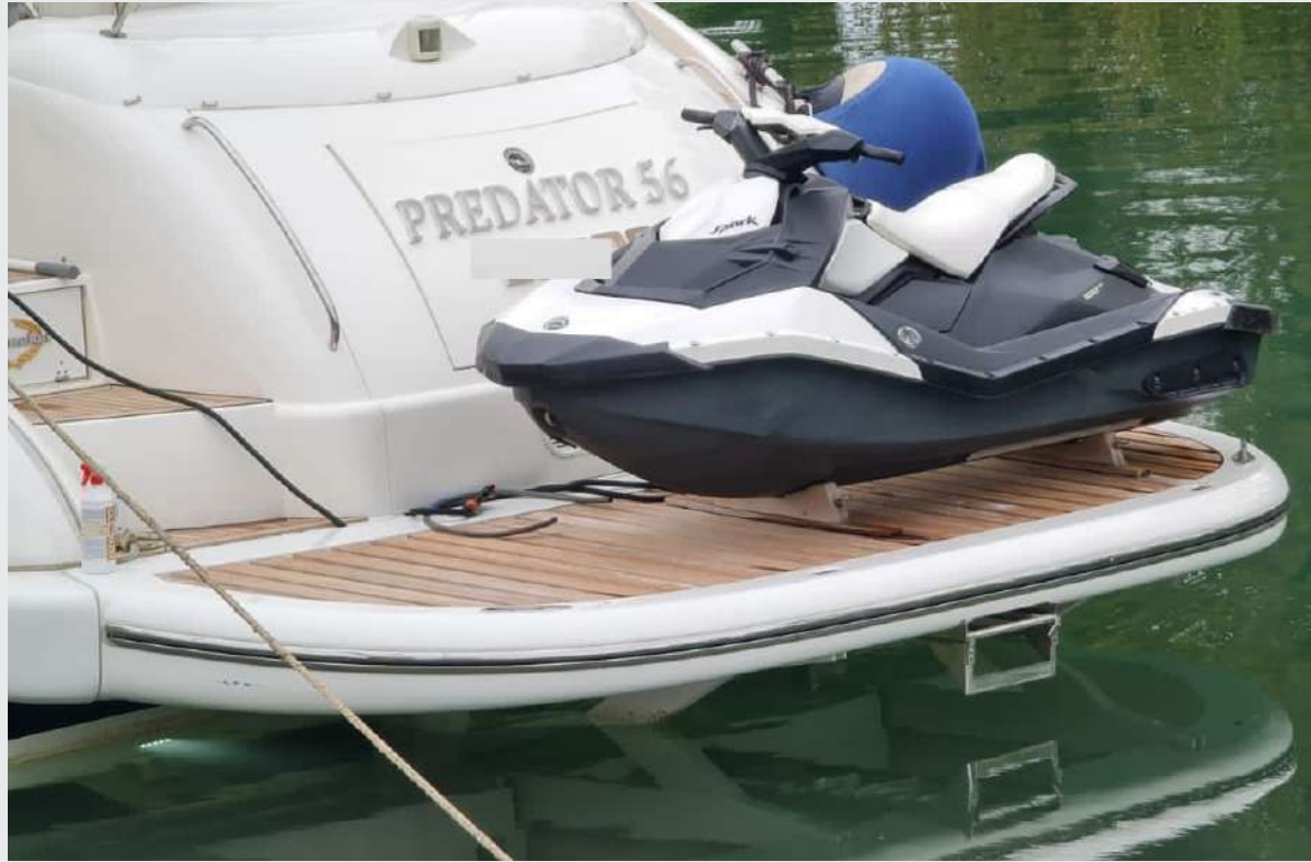
SUNSEEKER 56 PREDATOR