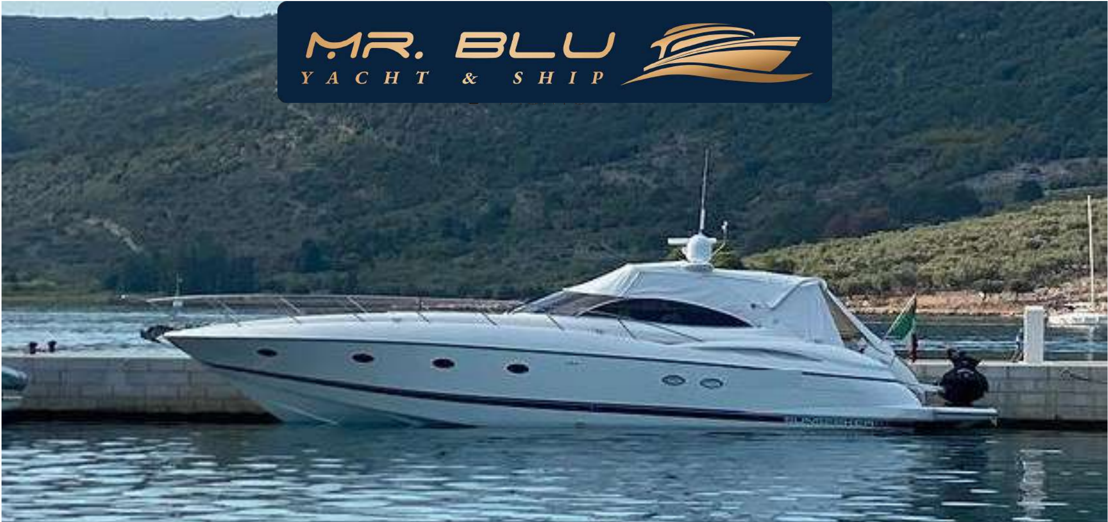
SUNSEEKER 56 PREDATOR